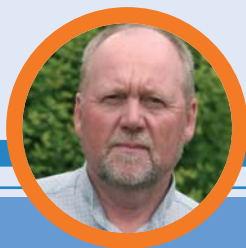
Wolfgang Ullrich Präsident des Handball- Verbandes Niedersachsen (HVN)