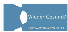
Foto-Wettbewerb zur 100-Jahr-Feier

Der vdek blickt im kommenden Jahr auf eine 100-jährige Geschichte zurück. Zu diesem Jubiläum ist ein Fotowettbewerb zum Thema „Wieder Gesund?“ ausgeschrieben. Er richtet sich an Studierende, die an einer (Hoch-)Schule für Fotografie oder Design eingeschrieben sind, sowie an junge Designer und Fotografen bis zu zwei Jahre nach Studienabschluss. Einsendeschluss ist der 14. Oktober 2011. Aus den prämierten Fotos wird im kommenden Jahr eine Wanderausstellung konzipiert,