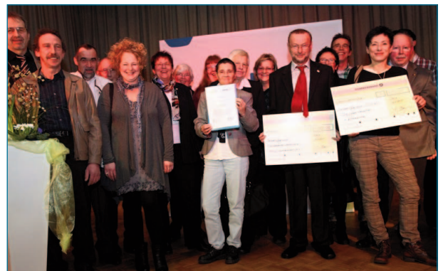
Preisträger und Mitwirkende bei der Verleihung des Rheinland-Pfälzischen Selbsthilfepreises der Ersatzkassen für 2010

Menschen dort abgeholt, wo sie im Moment stehen, und sie werden in ihrer Gruppe und aus der Gruppendynamik heraus in die Abstinenz begleitet. Ein großer Wert wird auf den Gruppenzusammenhalt – die Gruppenmitglieder sind rund um die Uhr füreinander erreichbar – und auf eine gemeinsame Freizeitgestaltung gelegt.