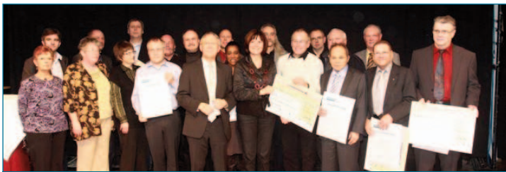
Preisträger und Mitwirkende bei der Verleihung des Rheinland-Pfälzischen Selbsthilfepreises der Ersatzkassen für 2009

Im Rahmen eines Festaktes in der Alten Patrone in Mainz wurde Ende Februar 2010 unter Mitwirkung von Gesundheitsministerin Malu Dreyer der „Rheinland-Pfälzische Selbsthilfepreis der Ersatzkassen“ für das Jahr 2009 verliehen. Gemeinsam mit der Landesarbeitsgemeinschaft der Selbsthilfekontaktstellen und Selbsthilfeunterstützung in Rheinland-Pfalz (LAG KISS RLP) würdigen die Ersatzkassen damit das herausragende Engagement der Akteure in der gesundheitsbezogenen Selbsthilfe.