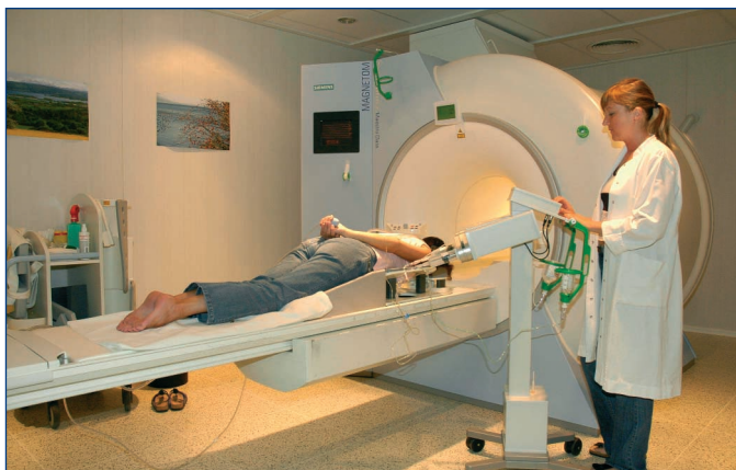
Eine Patientin wird für eine Kernspin-Untersuchung vorbereitet

Ärzten und Patientinnen bietet das DMP wissenschaftlich fundierte medizinische Leitlinien, mit denen die Behandlungsziele erreicht werden sollen. Die Erfahrungen mit dem DMP Diabetes im Saar-