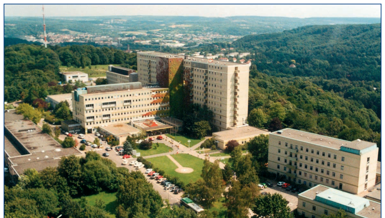
Das Klinikum Saarbrücken – Das KH-Gesetz steht, die Planung kommt im Herbst

Neu geregelt wurde auch die Krankenhausplanung. Grundlage bildet in Zukunft ein von einem Sachverständigen zu erstellendes Gutachten über die Versorgungssituation im Saarland und den künftig zu erwartenden Versorgungsbedarf. Die Planungsbehörde muss ihre beabsichtigten planerischen Festlegungen mit jedem einzelnen Krankenhaus in so genannten Planungsgesprächen erörtern, an denen jetzt auch jeweils ein Vertreter der Kostenträger teilnimmt. Planungsbehörde und Kostenträger müssen