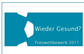
Foto-Wettbewerb zur 100-Jahr-Feier

Der vdek blickt im kommenden Jahr auf eine 100-jährige Geschichte zurück. Zu diesem Jubiläum ist ein Fotowettbewerb zum Thema „Wieder Gesund?“ ausgeschrieben.