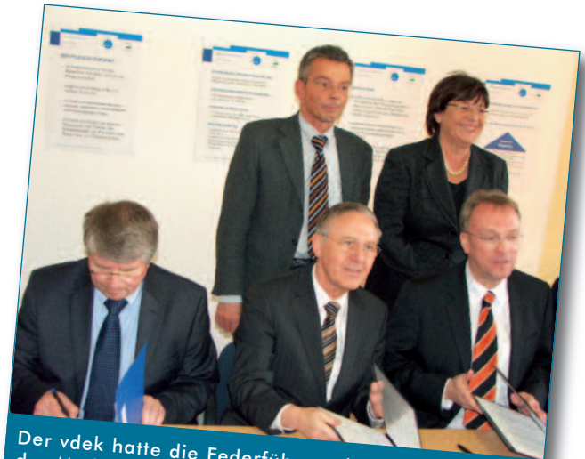
Der vdek hatte die Federführung bei der Einrichtung des Modellpflegestützpunktes in St. Wendel. Zur Unterzeichnung des Vertrages im März 2008 kamen Bundesgesundheitsministerin Ulla Schmidt und der saarländische Gesundheitsminister Josef Hecken.