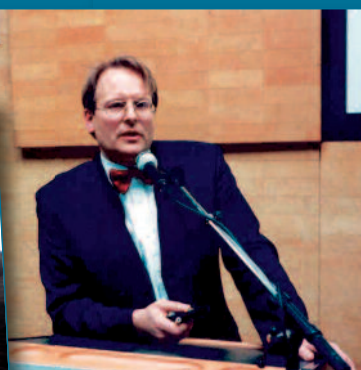
Prof. Dr. Dietrich Grönemeyer sprach beim Saarländischen Ersatzkassenforum 1998 über das Potenzial der „med in Germany“ als Exportschlager.