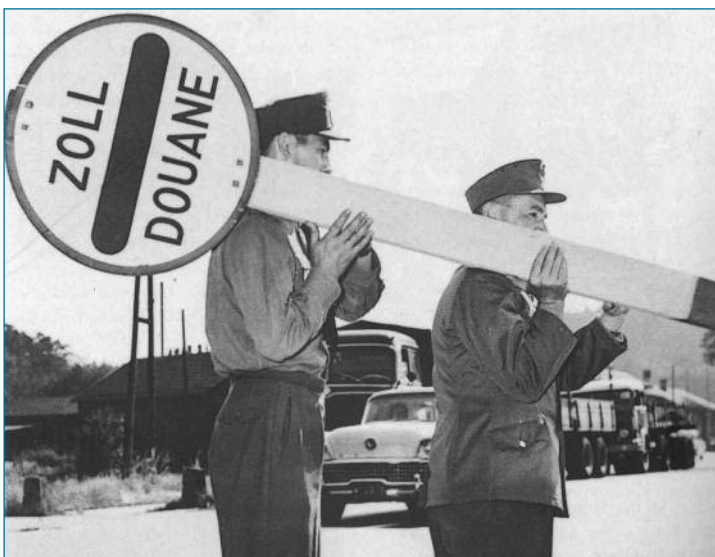
Für die Ersatzkassen öffneten sich die Zollschranken etwas später. Aber knapp ein Jahr nach dem Tag X konnten auch sie wieder im Saarland tätig werden.

Damit wurde der 1. April 1960 zum Tag X der Ersatzkassen. Endlich waren sie auch in dem neuen Bundesland Saarland wieder zugelassen. Die bis zum 1. Juli 1947 bestehenden acht selbstständigen Ortskrankenkassen wurden zu einer Allgemeinen Ortskrankenkasse zusammengefasst. Auch Betriebs- und Innungskrankenkassen konnten von diesem Zeitpunkt an im Saarland wieder errichtet werden. Das Saarland hatte nach 15 Jahren Einheitskasse wieder ein gegliedertes Sozialversicherungssystem.