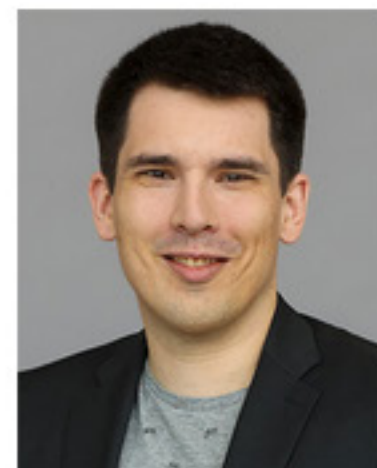
Alexander Salomon MdL Landtagsfraktion BÜNDNIS 90/Die Grünen, Vorsitzender der Enquetekommission „Krisenfeste Gesellschaft“ des Landtags Baden-Württemberg