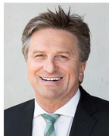
Manne Lucha MdL Minister für Soziales, Gesundheit und Integration des Landes Baden-Württemberg