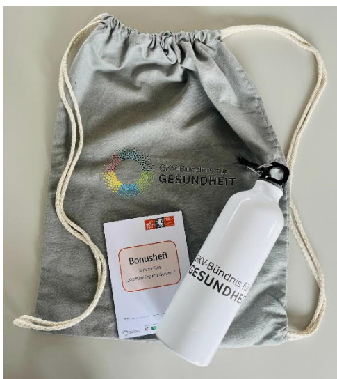
Turnbeutel und Trinkflasche

ausgefülltes Bonusheft einer Teilnehmerin