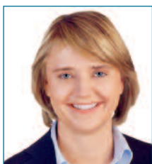
Annette Widmann-Mauz, MdB, Parl. Staatssekretärin