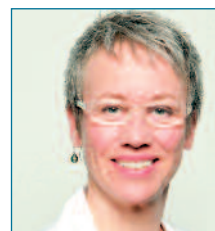
Birgitt Bender, MdB Bündnis 90/Die Grünen