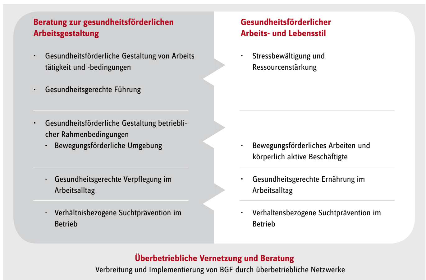
Abb. 8: Handlungsfelder (rot) und Präventionsprinzipien (Aufzählungspunkt) in der betrieblichen Gesundheitsförderung