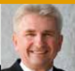
Prof. Dr. Andreas Pinkwart Minister für Wirtschaft, Innova- tion, Digitalisierung und Energie