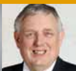
Karl-Josef Laumann Minister für Arbeit, Gesundheit und Soziales des Landes NRW