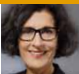
Vera Lux Universitätsklinikum Köln