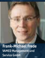
Frank-Michael Frede VAMED Management und Service GmbH