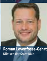
Roman Lovenfosse-Gehrt Kliniken der Stadt Köln

DAS GESUNDHEITSWESEN MUSS ZUSAMMEN- WACHSEN!