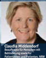
Claudia Middendorf Beauftragte für Menschen mit Behinderung sowie für Patientinnen und Patienten, NRW