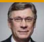
Staatssekretär Lutz Stroppe Bundesministerium für Gesundheit