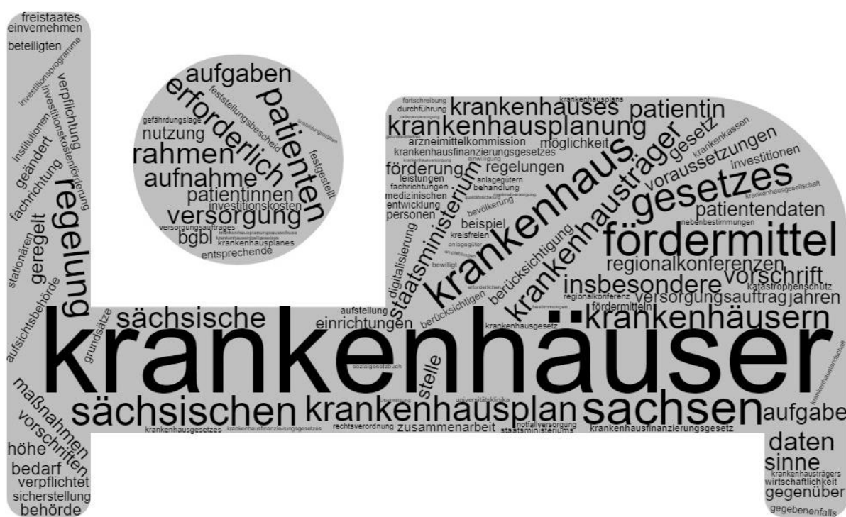
Grafik 1: Wortwolke auf Basis des Textes zum Referentenentwurf des SächsKHG

Da es aus Ersatzkassenperspektive hier noch Ergänzungs- bzw. Schärfungspotenzial auf Grund offener oder darüber hinaus noch zu treffender Formulierungen gibt, führen wir unsere Positionierung und Forderungen zu den angesprochenen Themenkomplexen im Folgenden näher aus.