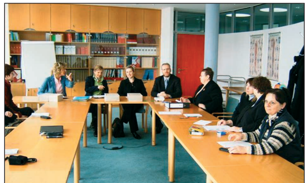
Zu einem ersten Auswertungsgespräch zur Einführung der Persönlichen Pflegebudgets in der Thüringer Landeshauptstadt trafen sich am 8. März 2005 Case ManagerInnen und Vertreter der Pflege-/Ersatzkassen

Bleibt zu hoffen, dass sich damit und mit weiteren Aktionen am Ende doch noch genügend Pflegebedürftige für das Persönliche Pflegebudget finden werden und das viel versprechende Modellprojekt die gesetzten hohen Ziele erreicht.