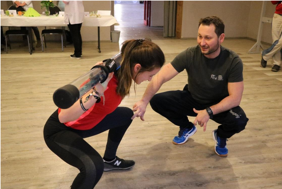
Foto: Nick Sense vom Altenburger Zentrum für Bewegung gibt wertvolle Tipps, um sich fit und gesund zu halten

Seite 3/3 der Pressemitteilung vom 01.02.2019