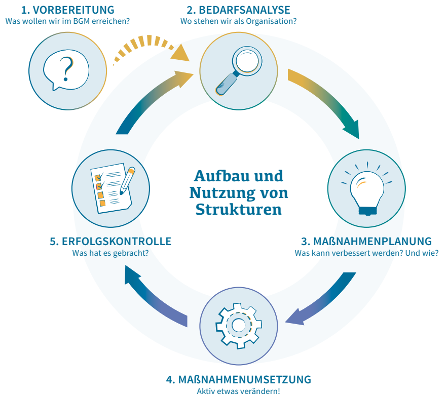
Abbildung: Betriebliches Gesundheitsmanagement als Prozess

MEHRWERT:PFLEGE ist ein kostenfreies Angebot.