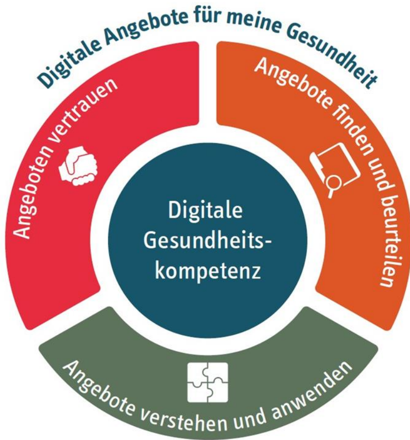
vdek-Modell: Digitale Gesundheitskompetenz