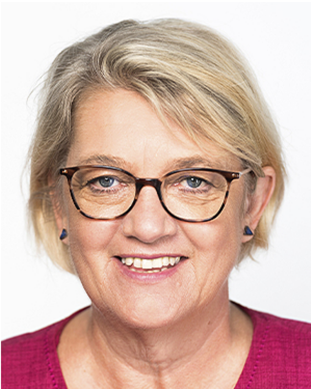
Kordula Schulz-Asche, MdB, Pflegepolitische Sprecherin der Bundestagsfraktion BÜNDNIS 90/DIE GRÜNEN, Mitglied im Gesundheitsausschuss des Deutschen Bundestages