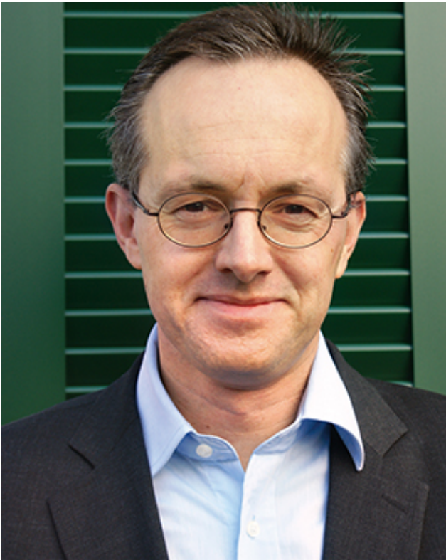
Moderation Florian Staeck, Ärzte Zeitung