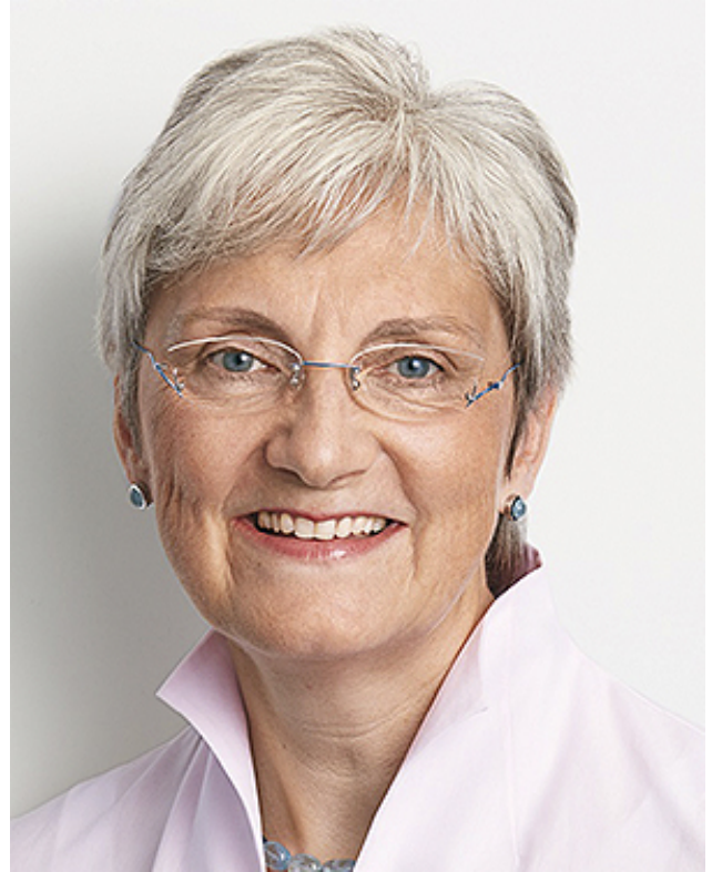
Heike Baehrens, MdB, Pflegepolitische Sprecherin der SPD- Bundestagsfraktion, Mitglied im Gesundheitsausschuss des Deutschen Bundestages