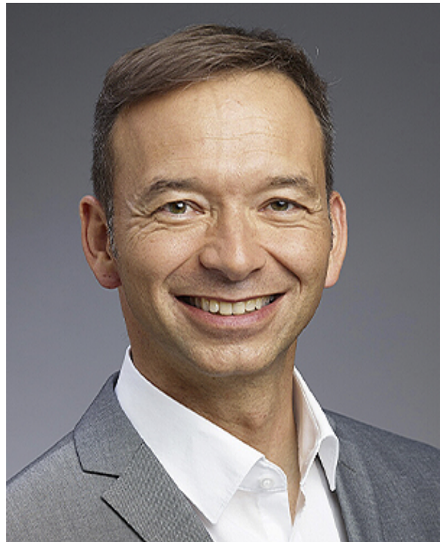
Pascal Kober, MdB, Sozialpolitischer Sprecher der FDP-Bundestagsfraktion