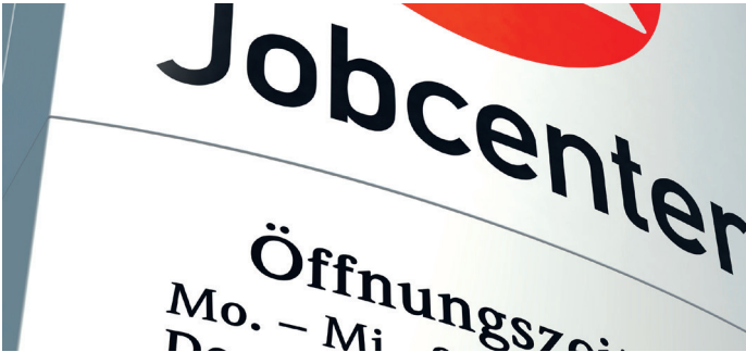
ERPROBUNG LÄUFT: Jobcenter vermitteln Gesundheitskurse

Im Vogtlandkreis haben die ersten Langzeitarbeitslosen an Gesundheitskursen teilgenommen, die über das Jobcenter Plauen vermittelt wurden. Bei diesem speziellen Angebot erhalten Teilnehmer Informationen zur gesunden Lebensführung, zur Verminderung von Stress und lernen mit der Lebenssituation „Arbeitslosigkeit“ umzugehen. Zwei Kurse mit 18 Teilnehmern fanden bereits statt, drei weitere sind inzwischen angelaufen. Eine Kooperation der Bundesanstalt für Arbeit und der gesetzlichen Krankenversicherung bildet die Basis für dieses Modellprojekt, das Arbeits- und Gesundheitsförderung verzahnt.