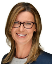
von SILKE HEINKE Leiterin der vdek-Landesvertretung Sachsen