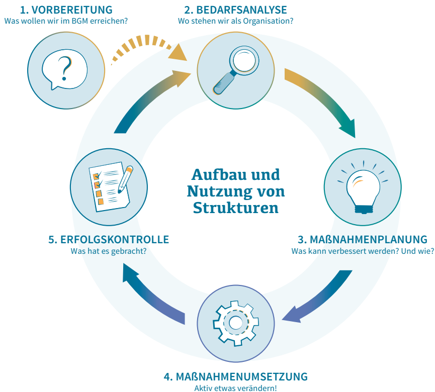
Abbildung: Betriebliches Gesundheitsmanagement als Prozess

MEHRWERT: PFLEGE ist ein kostenfreies Angebot.